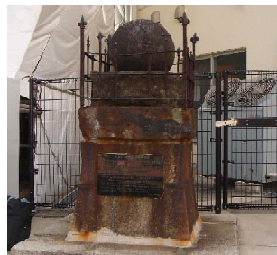
現在の鉄砲ん玉(元船町)