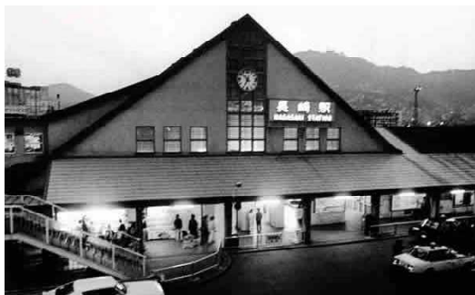
昭和 53 年旧長崎駅