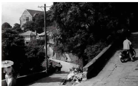
昭和 36 年オランダ坂通り写真提供:長崎おもいで散歩再編版 【発行:(株)春光社 写真:真木雄司】