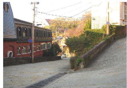
現在のオランダ坂通り